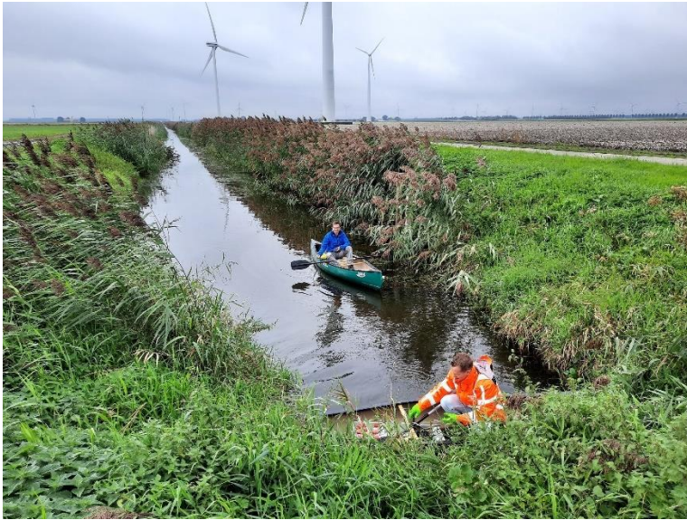
Metingen met kano in de tocht

Op twee kavels van één bedrijf meten we aan grondwater, drains en slotwater. We onderzoeken of er variatie is in waterkwaliteit tussen drains onder eenzelfde teelt en wat de verschillen zijn tussen teelten.