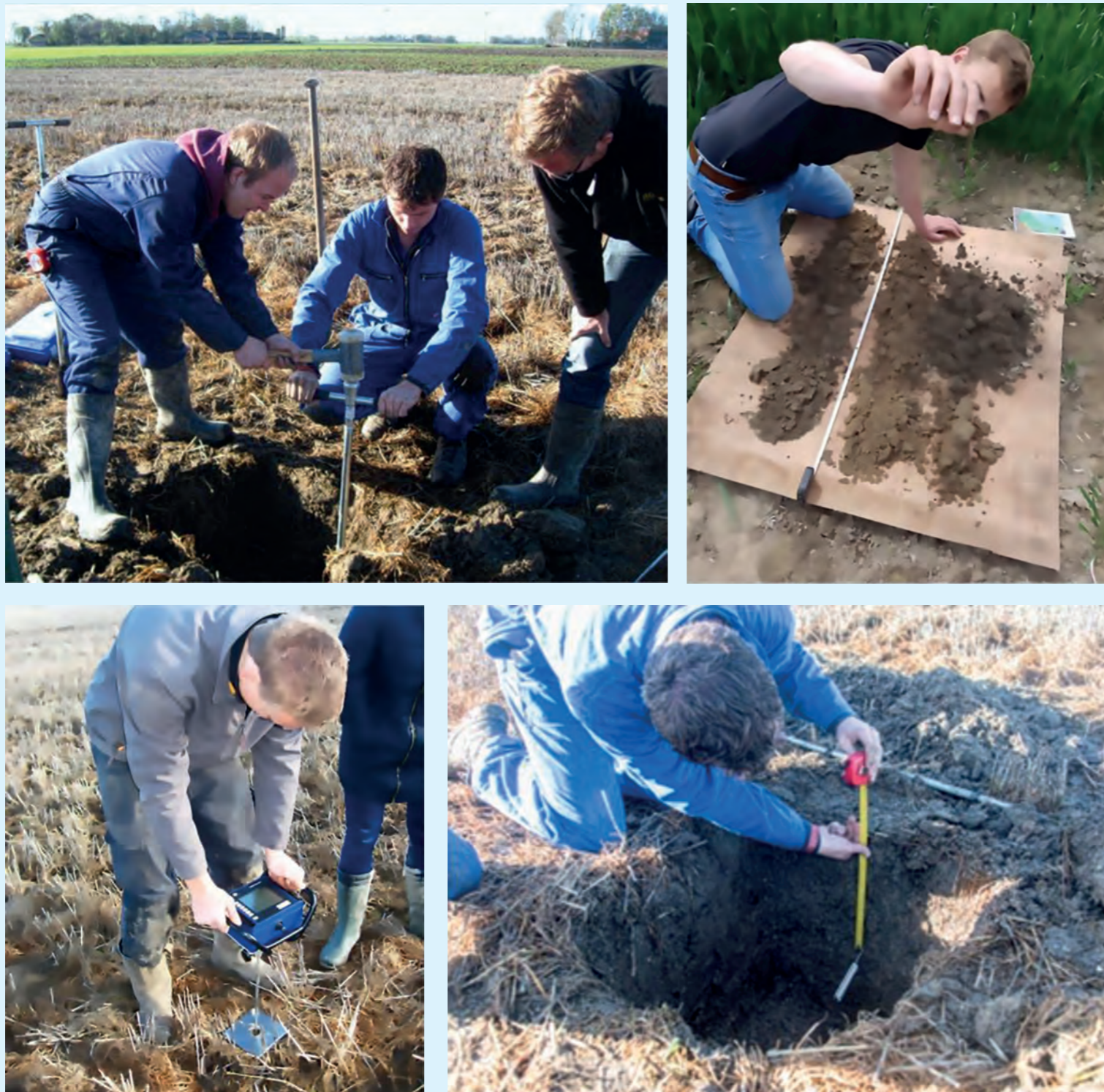
Proefpercelen selecteren met reguliere meettechnieken